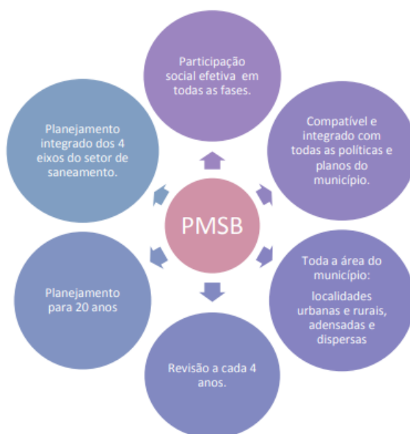
Figura 1 - Considerações gerais para elaboração do PMSB

O presente trabalho foi elaborado no que se refere ao abastecimento de água potável, esgotamento sanitário, limpeza urbana e manejo de resíduos sólidos, drenagem e manejo das águas pluviais urbanas, com objetivo exclusivo de atualização e unificação do PMSB e do PMGIRS, seguindo as considerações da FUNASA (2018).