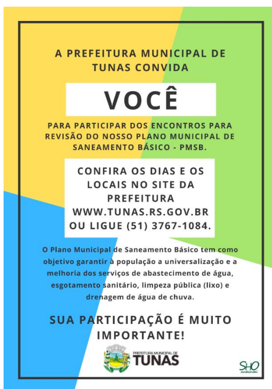
Figura 6 - Modelo de Cartaz