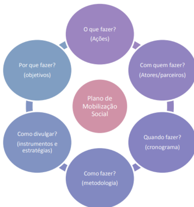
Figura 3 - Plano de Mobilização Social

O Plano de Mobilização Social é uma ferramenta para a participação da população em processos decisórios, que são fundamentais para garantir a relação entre setor público de saneamento e sociedade/comunidade, devendo responder as questões apresentadas na Figura 3.