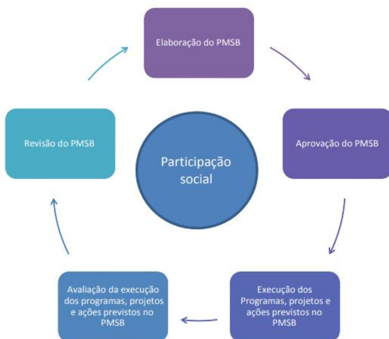
Figura 2 - Fluxo geral de planejamento do setor de saneamento

dentro desse período até a revisão, deve prever um planejamento de conferência e acompanhamento das propostas, para verificação do seu cumprimento, conforme fluxo geral de planejamento do setor de saneamento da FUNASA (2012) apresentado na Figura 2 abaixo.